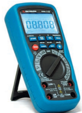
Рис. 8. Водонепроницаемый мультиметр АКТАКОМ АММ-1139

Нередки случаи, когда электроприборы эксплуатируются в помещениях, не соответствующих требованиям эксплуатации. При сильном нагреве или охлаждении изоляция может начать терять свои свойства. Это, в свою очередь, может привести к повреждению кабеля, а также подключённых к нему приборов и механизмов. В таких случаях, при проведении электроизмерительных работ очень полезным оказывается цифровой мультиметр АКТАКОМ АМ-1019 (рис. 9) Это