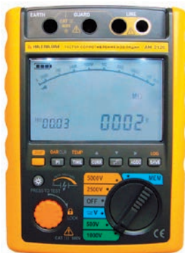
Рис. 10. Высоковольтный тестер сопротивления изоляции АКТАКОМ AM-2125

Еще один, пожалуй, самый популярный и востребованный цифровой многофункциональный мегаомметр АКТАКОМ AM-2002 (рис. 11) давно получил профессиональное признание специалистов. Как и модель AM-2125, мегаомметр AM-2002 предназначен для измерения сопротивления изоляции и высокоомных электрических цепей при различных рабочих, в том