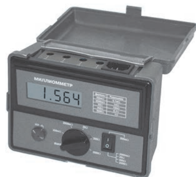
Рис. 12. Цифровой миллиомметр АКТАКОМ AM-6000

В своей работе специалисты ЭТЛ нередко сталкиваются с проблемами, когда на предприятиях к электроустановкам прокладывается множество сетей различного назначения — силовые цепи, цепи измерительных устройств, релейной защиты и автоматики, при этом допускаются нарушения, которые вызывают нежелательные помехи и электрические наводки на различные типы оборудования. Проще говоря, не всегда учитывается, что при монтаже