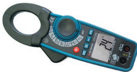
Рис. 6. Токовые клещи АКТАКОМ АСМ-2368

Хотя многие модели токовых клещей и имеют встроенный мультиметр, разнообразные измерительные задачи требуют отдельного применения этого вида приборов. Поэтому, при комплектации ЭТЛ функционалу мультиметров уделяется пристальное внимание, поскольку для проведения измерений, согласно действующим нормативным документам, подходят только специализированные профессиональные модели.