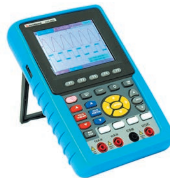
Рис. 17. Портативный осциллограф-мультиметр АКТАКОМ ADS-2029

В нашей статье мы рассказали лишь о нескольких, наиболее важных приборах АКТАКОМ, используемых ЭТЛ при проведении диагностики электрических сетей. На самом деле, электротехнические лаборатории, предоставляя свои услуги, используют достаточно много самого разнообразного оборудования, которое, благодаря точным измерениям, помогает избежать таких проблем, как утечка тока,