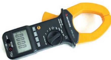
Рис. 5. Токоизмерительные клещи АКТАКОМ АСМ-2311

ству или даже использовать в составе измерительного комплекса для регистрации измеренных значений тока.