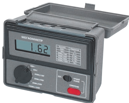
Рис. 11. Цифровой мегаомметр АКТАКОМ AM-2002

Измерение сопротивления изоляции и высокоомных цепей осуществляется в диапазонах 200 МОм и 1000 МОм, при этом испытательное напряжение на диапазоне 200 МОм может составлять 100 В, 250 В и 500 В, а на диапазоне 1000 МОм — 1000 В. Ток короткого замыкания равен примерно 2 мА. В режиме вольтметра AM-2002 работает на частотах 50...500 Гц и имеет всего один диапазон измерения — 600 В. Входное сопротивление вольтметра — около 4,5 МОм. Прибор обеспечивает защиту от перегрузки до 1000 В. Для измерения сопротивления в низкоомных цепях используется диапазон 200 Ом. Конструктивно прибор выполнен в ударопрочном корпусе с крышкой, которые обеспечивают защиту индикатора и органов управления при хранении и транспортировке.