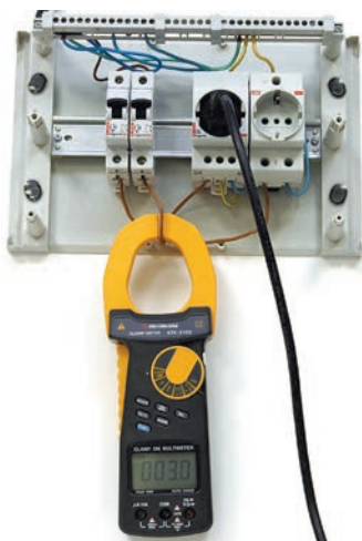
Рис. 4. Измерение переменного тока клещами АКТАКОМ ATK-2103

Следует выделить токовые клещи АКТАКОМ ATK-2120. По своей функциональности — это классические токовые клещи постоянного и переменного тока (до 1200 А). А вот наличие встроенного аналогового выхода позволяет использовать их в качестве адаптера для подключения их, например, к осциллографу для наблюдения формы сигнала или другому внешнему устрой-