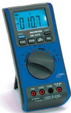
Рис. 9. Комбинируемый цифровой мультиметр АКТАКОМ AM-1019

Для безопасной работы всё электрическое оборудование должно иметь сопротивление изоляции, соответствующее определенным характеристикам. Из-за различных воздействий на оборудование качество изоляционных материалов со временем меняется, то есть снижается электрическое сопротивление изоляции, что приводит к увеличению тока утечки и, как следствие, к очень серьезным негативным последствиям.