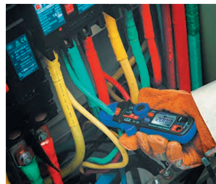
Рис. 2. Проведение измерений токовыми клещами

Как известно, в процессе доставки потребителю электрической энергии участвует множество разного электрооборудования — это силовые кабельные линии и провода, автоматические выключатели, счетчики, розетки, силовые щитки и многие другие устройства. Задача ЭТЛ состоит в том, чтобы проверить все звенья и составляющие электрической сети и выявить скрытые возможные дефекты. Особо пристальное внимание уделяется силовым линиям и проводам, им требуется не только визуальный осмотр, но и замер сопротивления изоляции и испытание повышенным напряжением.