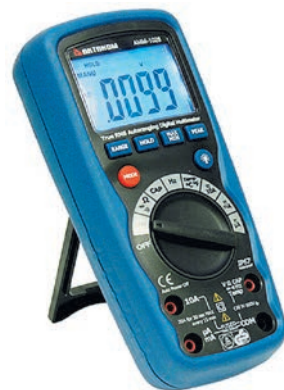
Рис. 7. Цифровой мультиметр АКТАКОМ АММ-1028

обеспечивающий безопасность и точность измерений в любых условиях, и предоставляющий максимум возможностей (рис. 8). Этот прибор имеет многофункциональный ЖКИ высокого разрешения с подсветкой и аналоговой шкалой, а также пик-детектор, функцию регистратора и режим измерения токовой петли. Возможность измерения истинных среднеквадратических значений (True RMS) позволяет корректно проводить измерения искажённых и несинусоидальных сигналов. Наличие быстродействующей графической шкалы даёт возможность наблюдать динамику изменения измеряемых величин.