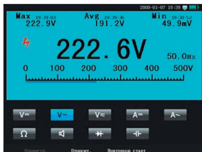
Рис. 16. Дисплей мультиметра в портативных осциллографах АКТАКОМ ADS-4xxx

Встроенный регистратор сигналов позволяет фиксировать результаты измерений осциллографа и мультиметра с разной временной шкалой (от 10 с/дел до 20 мин/дел), сохраняя при этом данные либо во внутреннюю память прибора, либо на внешний USB носитель.