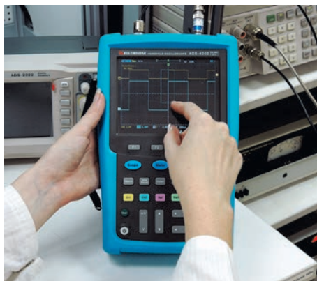
Рис. 14. Сенсорный дисплей портативного осциллографа АКТАКОМ серии ADS-4xxx

Полноценный инженерный калькулятор и приложение для пересчета электрических параметров, которые есть в этих осциллографах, часто используются сотрудниками ЭТЛ в работе (рис. 15). Осциллограф позволяет сохранять на внешнем USB носителе осциллограммы и текущие