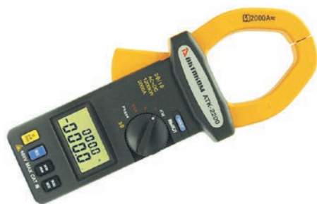
Рис. 3. Токовые клещи АКТАКОМ ATK-2200

Другая модель токовых клещей АКТАКОМ ATK-2103 совмещает в себе функциональность двух приборов: собственно токоизмерительных клещей и мультиметра (рис. 4). Уникальность этой модели состоит в том, что благодаря большому диаметру охвата магнитопровода (для плоских шин — 60 мм, для круглых проводников — 50 мм) бесконтактным способом прибор позволяет измерять ток до 2000 А, а при помощи встроенного мультиметра, аж с микроамперного диапазона! Комбинация двух приборов в одном корпусе делает ATK-2103 универсальным в применении инструментом и обеспечивает возможность измерения до 8 электрических величин. ATK-2200 и ATK-2103 — поистине уникальные приборы, порой даже не имеющие аналогов на российском рынке.