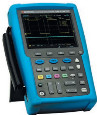
Рис. 13. Осциллограф-мультиметр-регистратор ADS-4112

Оциллографы этой серии имеют ударопрочные корпуса с защитой IP51, оснащены информативным сенсорным TFT дисплеем размером 5,7" и разрешением 640×480 точек, позволяющим отображать осциллограммы в мельчайших подробностях (рис. 14). Дисплей инверсный, т.е. оператор может в зависимости от внешних условий и освещения изменить схему отображения — цветные осциллограммы на черном или на белом фоне. Применение сенсорного дисплея позволило уменьшить размеры панели управления и перенести часть настроек в режим использования экранных кнопок. Особенно удобно применение экранных кнопок при необходимости ввода числовых значений.